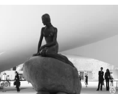
4月27日，世博园冰岛馆上，施工人员正在忙碌(图一)；丹麦馆“美人鱼”引人关注(图二)。