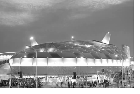
日本馆 (均为新华社发)