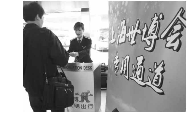
□记者 房贤刚 通讯员 朱密 报道 游上海世博 享周到服务

□记者 王亚楠 通讯员 姜海涛 报道 本报上海4月26日讯 世博会即将迎来世界各地的宾朋,而我省的苍山县也为此开始了紧张的忙碌:每天要向世博会提供16个品种、120吨以上的专供蔬菜。这是记者在今天举行的“新苍山”优质蔬菜进世博新闻发布会上获悉的。