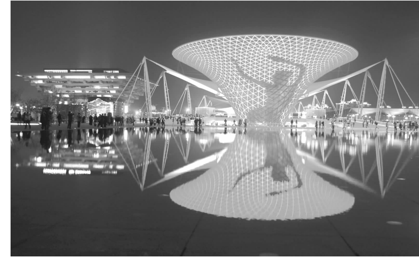
4月25日晚,中国馆、阳光谷等标志建筑在“水镜”倒映,引人注目。近日,上海世博会景观水景——庆典广场“水镜”开始试运行。据介绍,“水镜”可以反射“一轴四馆”建筑,还会产生喷雾效果,成为世博园区主要的景观水景,受到游客青睐。