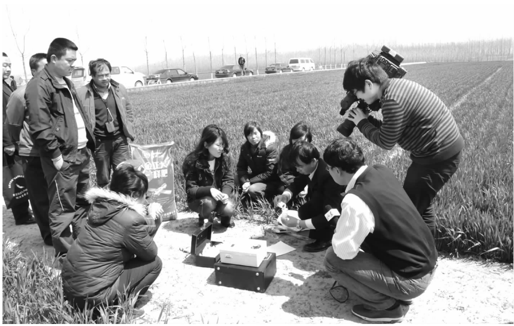
金正大农化服务专家开展田间测土配方施肥服务

作为全国缓控释肥行业排头兵的金正大集团,围绕全国农业技术推广服务中心将缓控释肥作为农技主推技术的发展良机,通过开展“缓控释肥普及大讲堂”、“全国缓控释肥示范推广万里行”、“金正大缓控释肥万村千乡科技入户工程”等一系列活动推广缓控释肥,在为农民提供优质高效缓控释肥产品的同时,送去了农民急需的科学施肥理念和种田知识,有力地促进了农业增产、农民增收。