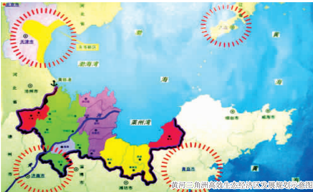
黄河三角洲高效生态经济区发展规划示意图

“转方式，调结构”，在山东有了“彩色的注解，那就是发展“蓝色”经济，开发“黄三角”，将“绿色”理念融入发展战略。“蓝黄战略”引领“绿色”发展，这就是山东“转方式，调结构”的重要载体，也是山东经济进一步减少“灰色”比重的调色过程。