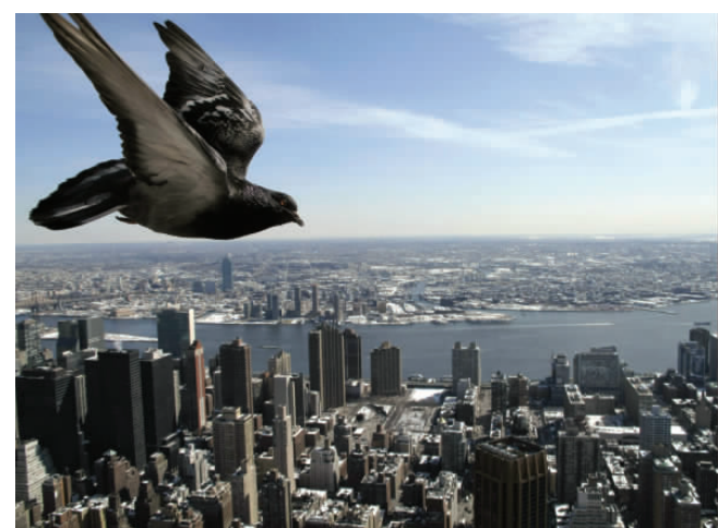
2009年3月3日,一只鸽子在美国纽约上空飞行。