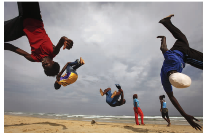
2009年11月14日,在塞内加尔首都达喀尔的海滩上,“游牧人舞蹈团”的成员在表演舞蹈。