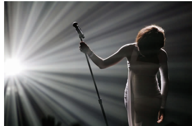
2009年11月22日,在美国洛杉矶举行的2009年美国音乐奖颁奖典礼上,歌星惠特妮·休斯顿在演唱后向观众鞠躬致意。

只要用心发现,生活中从来就不缺少美,寻觅一个合适的角落,小心调试好手中的相机,将光与影捕获,我们每个人都留住美丽,哪怕瞬间,也是永恒……