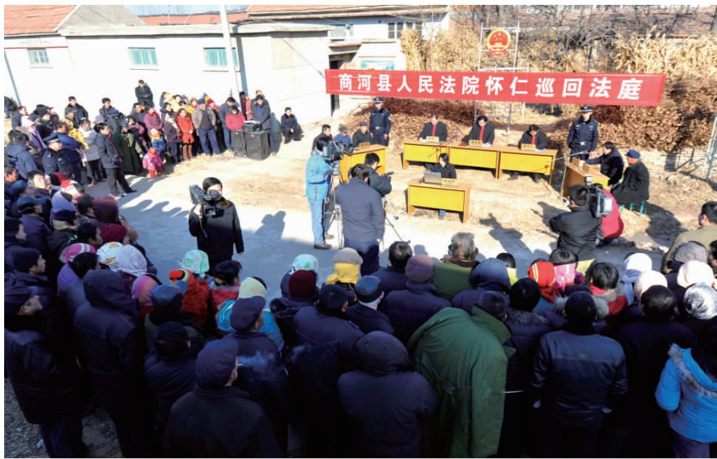
▲巡回法庭方便了群众诉讼,化解了群众纠纷,同时又是一个对村民进行普法教育的好机会。