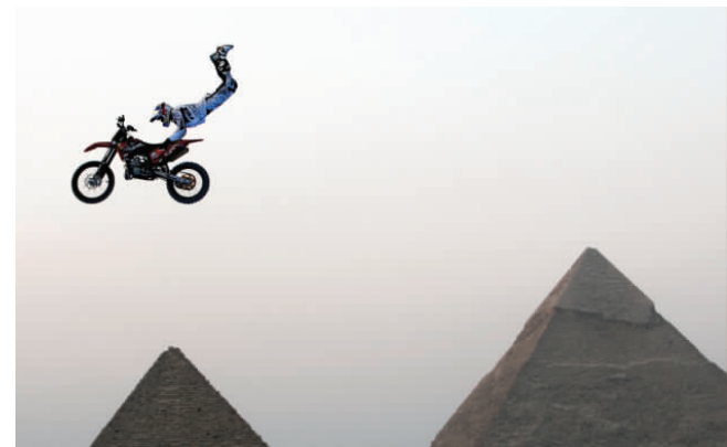
2009年4月10日,在埃及首都开罗举行的2009年国际自由式摩托车越野赛上,一名摩托车手在金字塔旁做出飞跃动作。