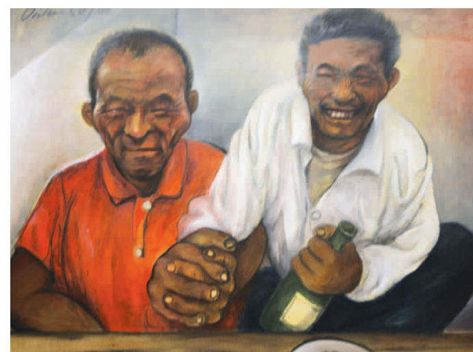
啥也别说了(油画) 张建国