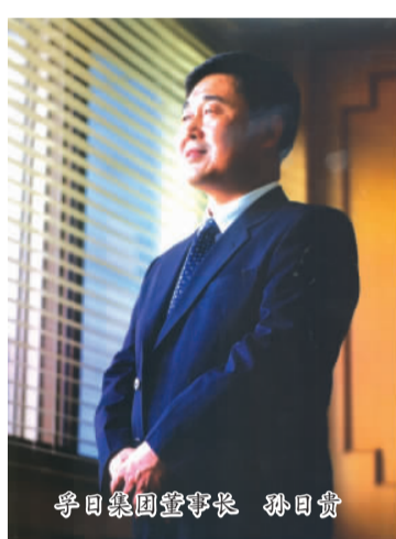
孚日集团董事长 孙日贵