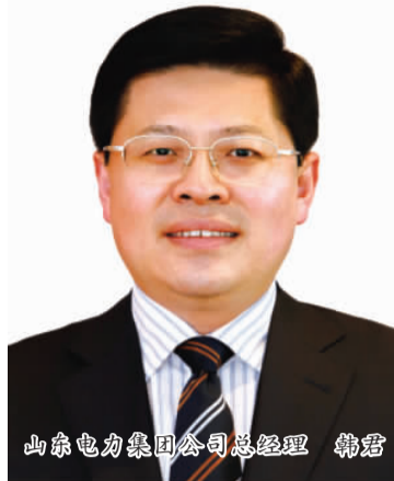
山东电力集团公司总经理 韩君