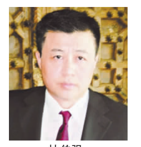
林伯强 著名能源经济学家

在国际金融危机的巨大冲击面前，2009年，山东经济依然保持了较快的发展势头，经济总量跃居全国第二。