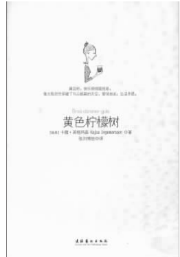
《黄色柠檬树》 (瑞典)卡撒·英格玛森 著 文化艺术出版社

中国经济驶上了积累财富的快车道，但这并不意味着我们可以高枕无忧了，生活、教育、就业环境依然面临着众多挑战，中国经济的许多迷惑还需要解答。