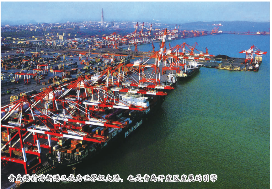
青岛港前湾新港已成为世界级大港，也是青岛开发区发展的引擎

在山东省对建设半岛蓝色经济区刚刚作出战略部署之际，青岛开发区即已经启动起了强烈的“蓝色”发展冲动。