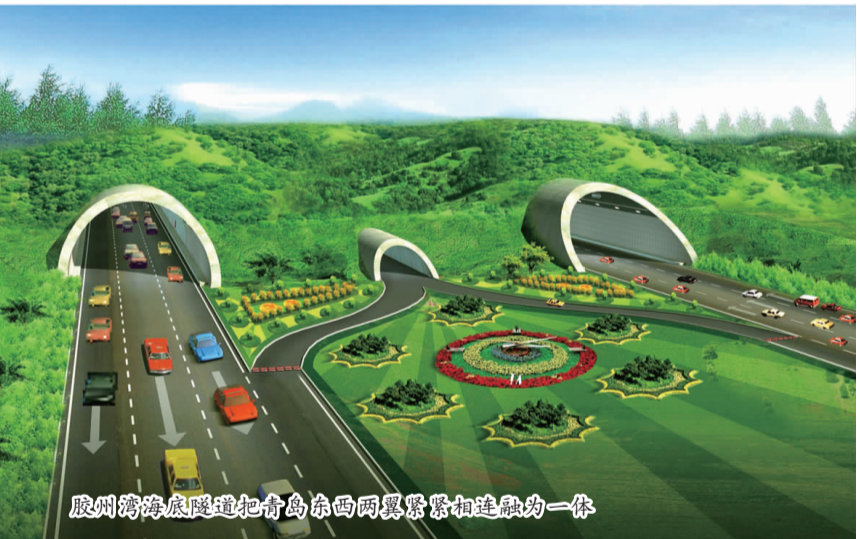
胶州湾海底隧道把青岛东西两岸紧紧相连融为一体

建设蓝色经济区，青岛开发区产业优势十分突出。近几年，青岛开发区围绕胶州湾潜力培育起的港口、石化、海洋工程、船舶等“蓝色”产业集群，不但成为拉动西海岸区域经济发展的绝对主力，也成为青岛进行产业结构优化调整，实现产业升级的主要依托。“青岛开发区作为青岛市‘环湾保