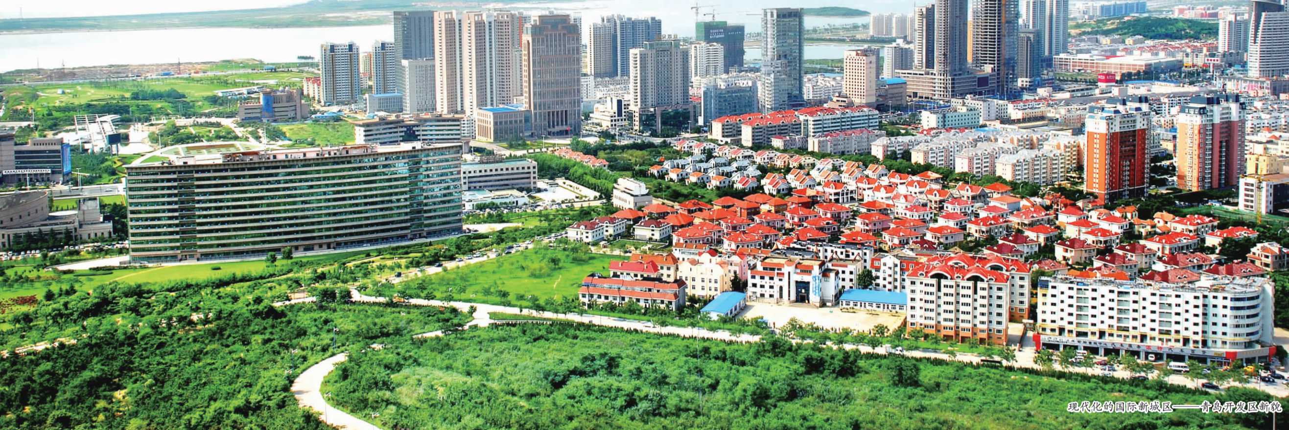
现代化的国际新城区——青岛开发区新貌