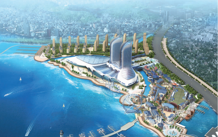
已开工建设的海上嘉年华项目是青岛开发区旅游业步入高端的代表