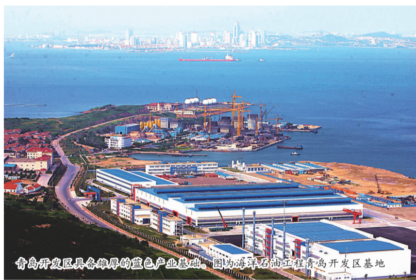
青岛开发区具备雄厚的蓝色产业基础。图为海洋石油工程青岛开发区基地

联动“大通关”运作机制，建立符合市场经济和世贸组织规则要求的涉外经济管理体制和运行机制。