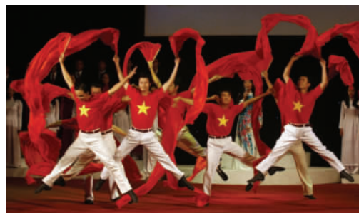
越南 ▲2009年9月1日，越南首都河内举行国庆晚会，庆祝越南社会主义共和国成立64周年。