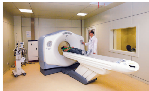
东院区配备的GE新一代128层容积CT—Lightspeed VCT,具有低辐射高清晰成像、高时间分辨率的优点,可以实现大范围动态扫描。