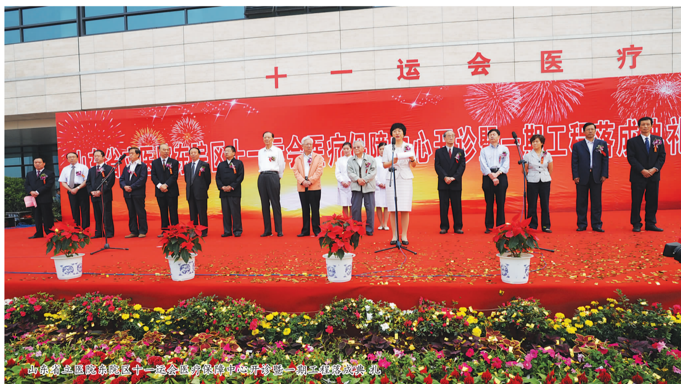
山东省立医院东院区十一运会医疗保障中心开业暨一期工程落成典礼

近年来,医院先后荣获“全国卫生系统先进集体”、“全国十佳文明服务示范医院”、“全国百佳医院”、“全国创建文明行业先进单位”、“全国首批百姓放心示范医院”、“全国首批管理创新单位”、“全国思想政治工作先进集体”等荣誉称号。