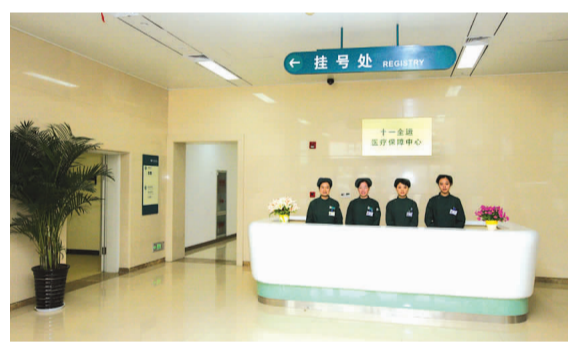
东院区急诊护士站

宽阔、通畅的门诊医疗主街是东院区的创新性设计,三条主街贯通南北、动静结合,不仅使患者就诊更加便捷,更使医疗流程更加简洁,其规模、功能都在国内医院中首屈一指。