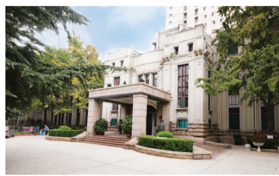
具有百年历史的原省立医院门诊病房楼