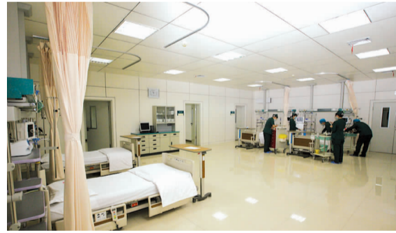
东院区急诊抢救室