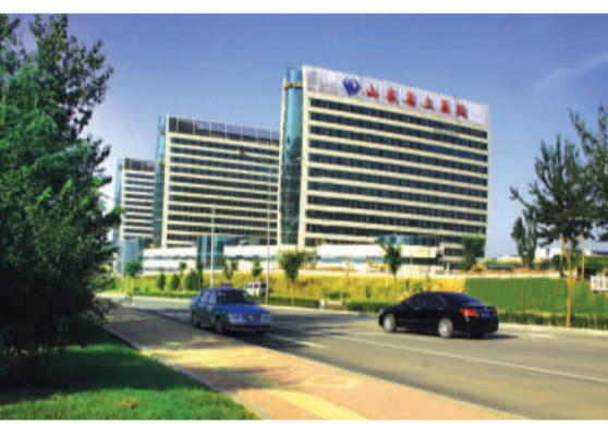
正在崛起的山东省立医院东院区