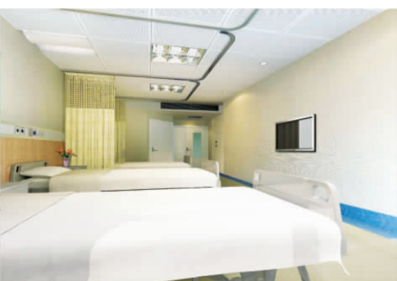
淡雅、宁静的现代化病房,温馨、便捷。

东院区手术室是集数字化、信息化于一体,与国际接轨的现代化多功能综合手术室,一期20个手术房间全部采用了空气净化系统,配备了一流的手术设备、仪器,全部电动手术床、进口顶级品牌吊塔、无影灯,手术室器械清洗消毒灭菌实现了手术室—供应室一体化管理。