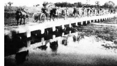
人民解放军通过流亭桥进入青岛市区。