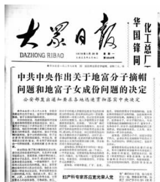
▲1979年1月29日，大众日报刊发了中央5号文件的消息，明确为地主、富农分子摘帽问题。