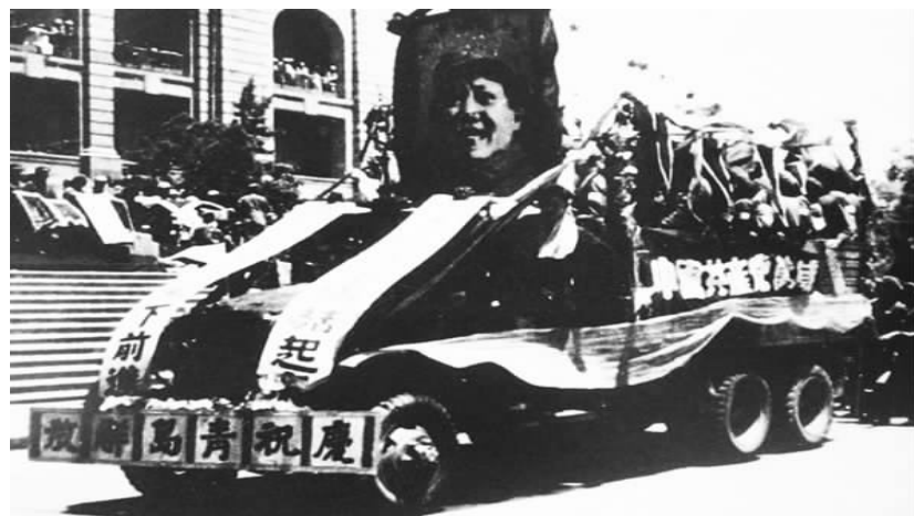
1949年6月2日，中国人民解放军攻占并解放青岛，至此山东全境解放。这是庆祝青岛解放的游行彩车经过市政府门前。

目前尚没有关于毛主席思考具体内容的有关记载，但从他日后的批复文字及相关史料分析，毛主席显然与山东军区前线指挥员们想到了一起——除了考虑到青岛是一座美丽的海滨