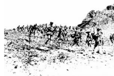
青即战役人民解放军攻下铁骑山，突破敌人的第二道防线。