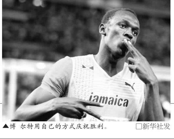
▲博尔特用自己的方式庆祝胜利。

了,这次比赛对我来说是场盛宴,我的目标就是缔造传奇。今天赛前,几乎没有人怀疑他会再次打破200米世界纪录。所以,当19秒19的数字闪亮出来时,8万人爆满的柏林奥林匹克体育场里的海啸声,不像3天前那样猛烈,多数体育记者也失去了震惊和愕然,因为,博尔特创造这神奇纪录太容易了:这个速度到底有多快,大家都糊涂了,因为,别人和他完全无法同场竞技。从某种意义上说,博尔特已经不是人,准确地说,他是地球人中的异类,他应该和其他物种去比赛。自从有人类以来,没有人能跑得像他一样快,相信以后的若干年中,也不会再有人比他跑得快。博尔特已经失去了可比性,幸亏美国的盖伊识趣地退出200米竞争,否则,只能是自取其辱。