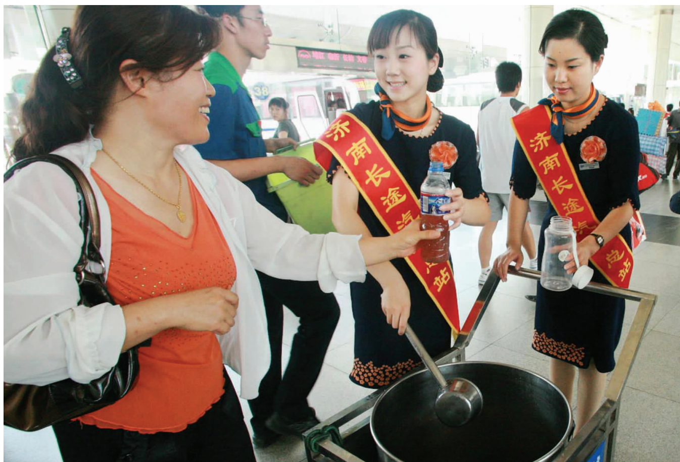
6月24日,济南长途汽车总站员工为候车旅客送上清凉消暑的绿豆汤。