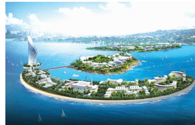
小麦岛,位于崂山区,投资100亿元,建设一个以超五星级酒店为核心的集旅游、会展等高端综合项目为一体的滨海建筑群。