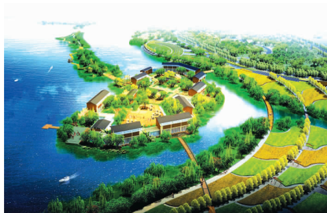
少海南湖休闲公园,位于胶州市,投资8亿元,建设湿地公园、体育休闲运动公园等,计划2010年完工。