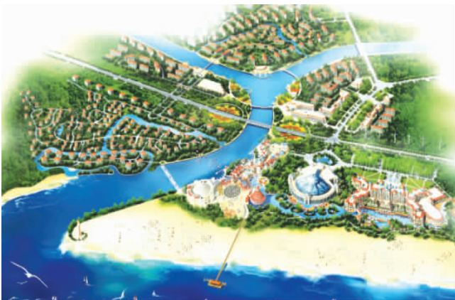
港中旅青岛海泉湾,位于即墨市,投资46亿元,建设五星级酒店、大型温泉洗浴、演艺中心等。计划2010年完工。