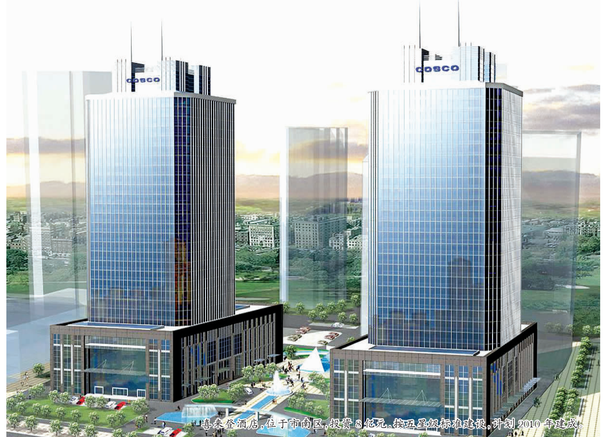
喜来登酒店,位于市南区,投资3亿元,按五星级标准建设,计划2010年建成。

城投旅游公司成立伊始,就把整体上市工作提上议事日程。我们将争取在2009年引进行业内有国际影响力的战略投资者,实施城投旅游股份制改造。股份制改造的同时,启动上市工作,实施资产重组、业务重组和财务重组,争取在相关证券市场上,筹集所得资金全部用于旅游项目建设、业务拓展和提升,并进行收购兼并工作,将城投旅游打造成为整合青岛及周边旅游资源的平台,借助资本市场,实现跨越式发展,迅速成长为青岛旅游产业领军企业,发展成为国内最具有重要影响力的上市旅游集团。