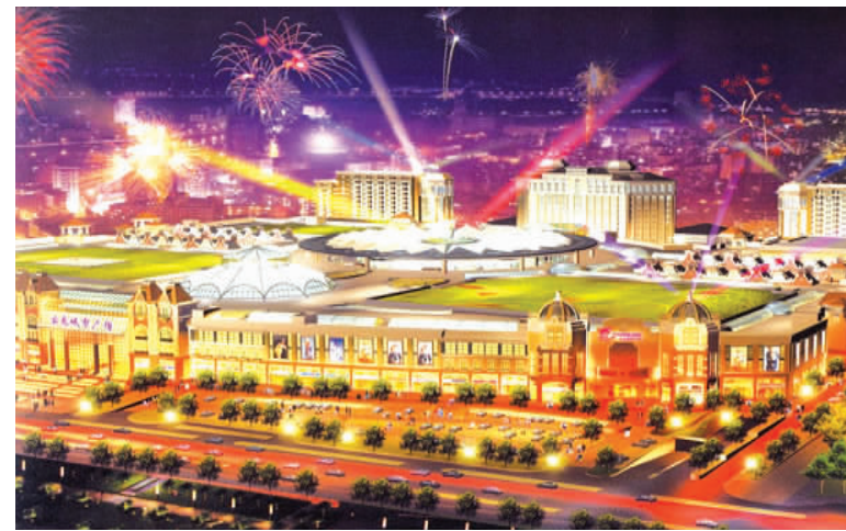
宝龙广场,位于城阳区,投资25亿,是我市首家大型旅游休闲购物娱乐中心,2009年游乐等部分项目对外营业。