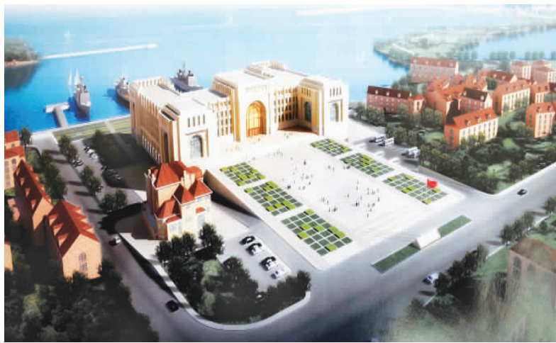
海军博物馆扩建项目,位于市南区,投资4亿元,扩建后的博物馆将成为一座充分展示我国海军发展历史的专业性博物馆,由藏品展览馆、海上展览区、海军广场等功能区组成,计划2012年建成。

金融危机的到来,对港中旅集团2008年的经营产生了很大影响,也给2009年的工作带来了严峻挑战。集团提出,2009年将以“保生存、促发展”为方针来开展各项工作。百年不遇的危机中,也孕育着百年不遇的机遇,我们要在保生存的同时,继续寻找发展的机会。集团对青岛项目高度重视,经反复研讨后决定,暂停集团在其它地区的一些在建项目,保留青岛项目继续上,并调整配备了新的领导班子,抓紧项目建设,做好“装船等水”的准备,在经济复苏的大潮到来之际,能立刻扬帆启航,抢占先机,把青岛海泉湾项目建设好,筹备好,力争开业后一炮打响。