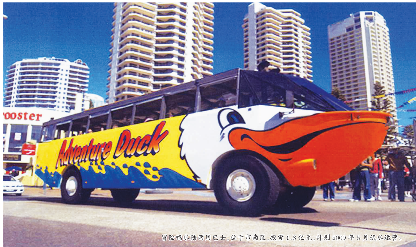
冒险鸭水陆两用巴士,位于市南区,投资1.8亿元,计划2009年5月试水运营。