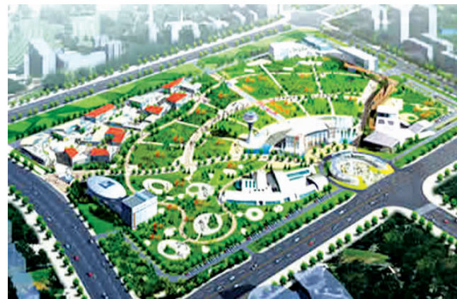
啤酒城项目,位于崂山区,投资100亿元,建成集节庆文化、休闲商业、旅游三大功能为一体的文化旅游中心,计划2014年完工。