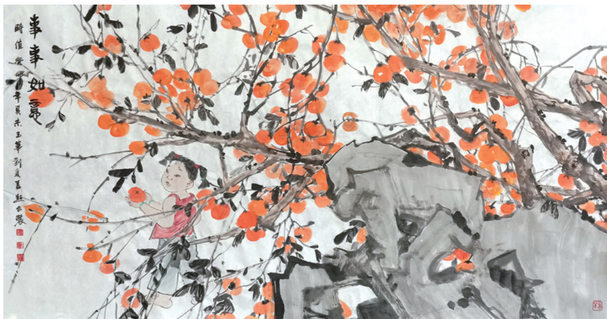
《事事如意》 96cm×178cm 王小晖 徐玉华 刘爱 姜超