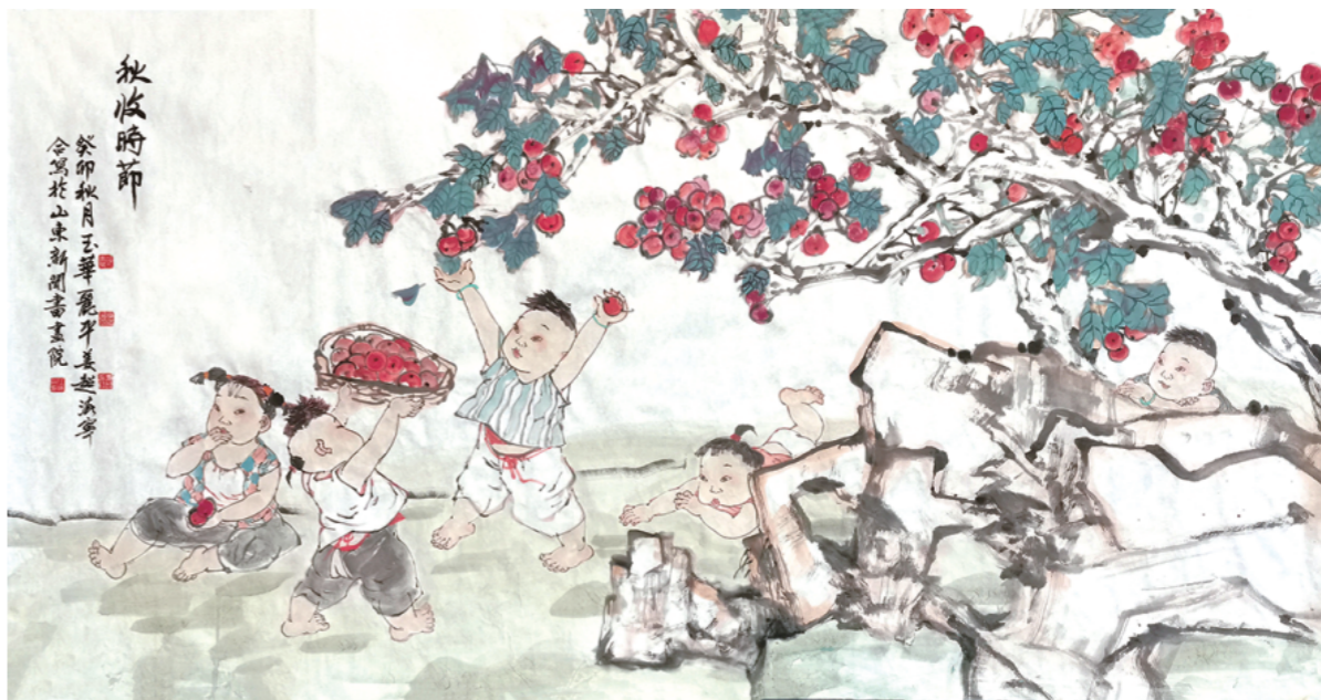
《秋收时节》 96cm×178cm 王小晖 徐玉华 李丽平 姜超 任海宁