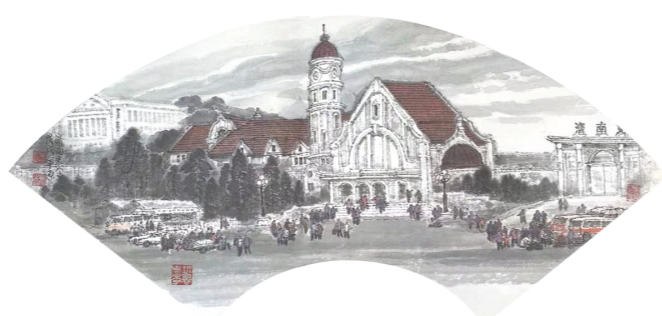
(图三)济南老火车站 国画扇面小品 丁宁原