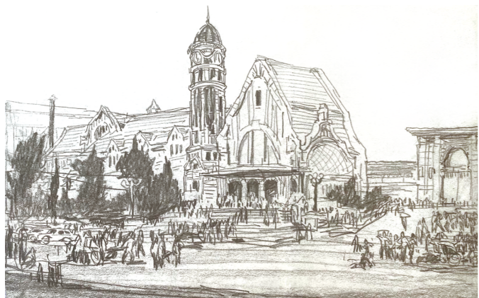
(图一)济南老火车站速写 丁宁原