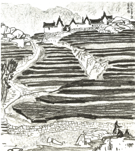
春田新绿 20cm×22cm 1980年 丁宁原