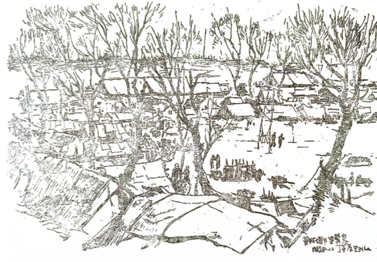
(图五)黄河坝下安营寨 丁宁原