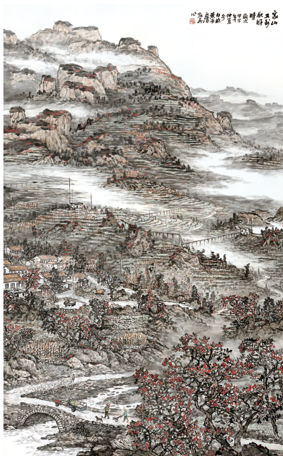
《家山又到秋好时》 年敦华