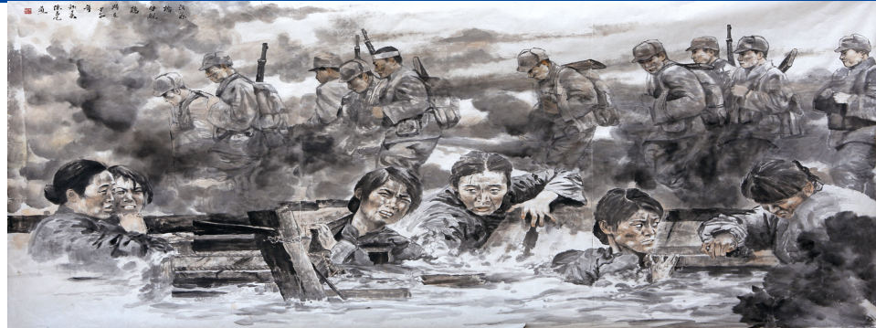
《沂蒙桥·母亲桥》 张占乙