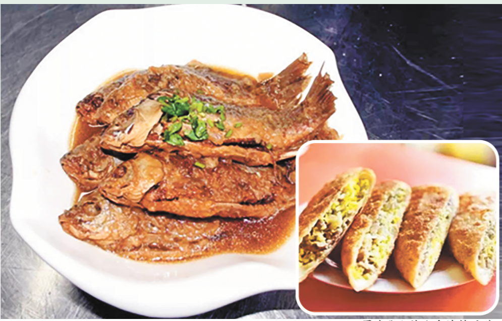
图为张秋炖鱼和沙镇呱嗒

找到与生活的连接点，讲好文化遗产故事就找准了焦点。那些爆红的故宮文创产品就是生动注脚。