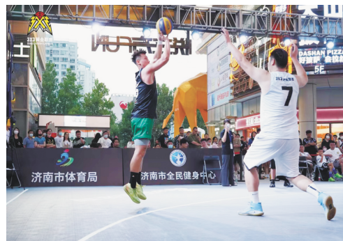
2022新浪3x3黄金联赛山东大区赛

2023年是推进体育强省建设的关键之年，是竞技备战积蓄力量的关键之年，济南市体育系统将继续按照济南市委、市政府的工作安排，勠力同心，锐意进取，争分夺秒，真抓实干，以昂扬的激情、奋斗的姿态、坚韧的意志和务实的作风，推进全市体育事业高质量发展，为加快建设“强新优富美高”新时代社会主义现代化强省会贡献体育力量。