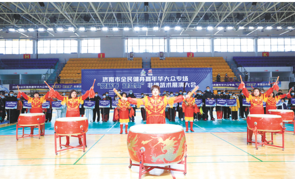
济南非遗武术展演大会

既包括篮球、排球、足球等传统项目，又包含着冰雪、板球等新兴特色项目，赛事贯穿全年，扎根校园、市县校班四级联动、小初高全学段全覆盖，青少年体育健康发展进一步巩固。针对济南市体育产业现状，济南市体育局