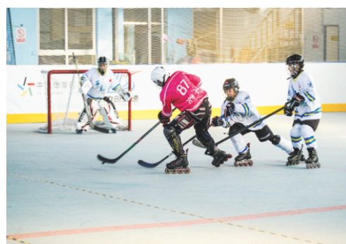
济南市第四届冬季全民健身运动会暨槐荫区第十二届全民健身运动会轮滑冰球比赛