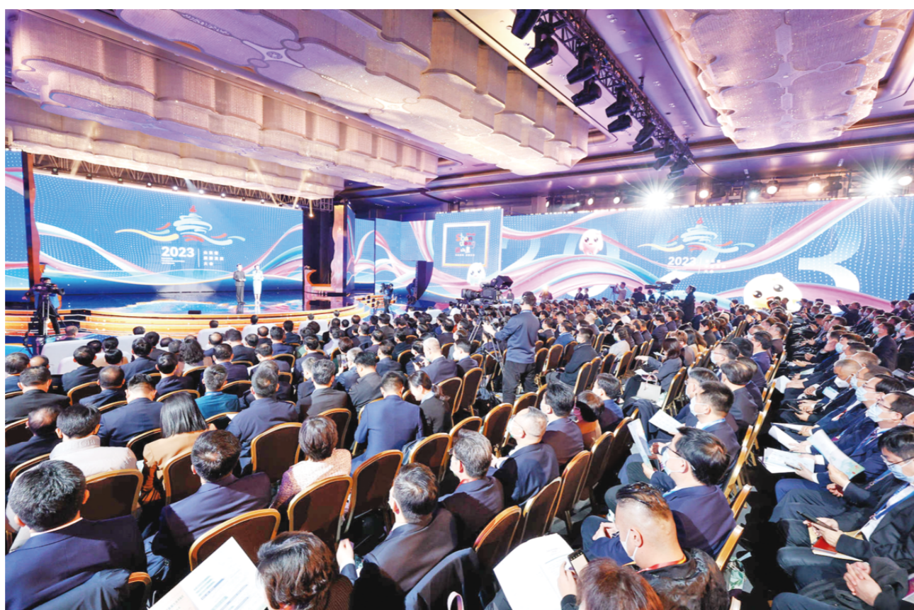
3月26日下午，2023山东省旅游发展大会在青岛国际会议中心开幕。国内外嘉宾齐聚岛城，围绕“相约时尚青岛，共享好客山东”主题，畅叙友情、畅谈合作，共谋文化旅游高质量发展。

开幕式面向全网直播，文化和旅游部副部长杜江，山西省副省长熊继军，甘肃省副省长李刚，山东省及济南市、青岛市领导白玉刚、曾赞荣、张海波、宋军继、邓云锋、于海田、赵豪志，多国驻华使节、沿黄、对口支援、东西部协作及部分重点客源地省份文旅部门负责人，金融投资机构、航空公司、康养企业、旅游电商企业、大型旅游企业负责人，山东省16市负责同志，专家学者及社会各界代表等参加主会场活动。各市、县（市、区）设分会场。