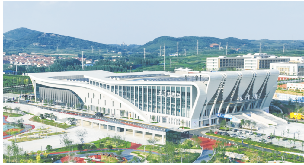
新建市民体育中心，高标准筹办第25届省运会，聚力建设文体产业融合发展名城，获评山东省体育强省建设先进集体。

蓝图已绘就，奋进正当时。站在新的起点上，五莲县将继续保持昂扬的斗志、踏实的作风，以奔跑的姿态、拼抢的劲头、争先的气魄，脚踏实地、埋头苦干、开拓创新，奋力续写加快富强、秀美、精致、活力的现代化锦绣五莲建设新篇章。