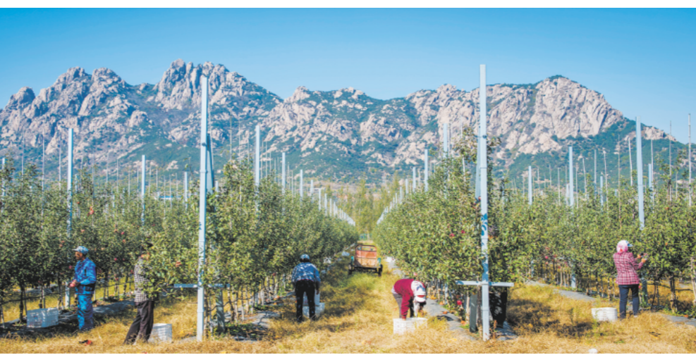
丰沃集团坚持“品种选育组培工程—大田育苗—示范果园—果园建设”的全产业链布局，在五莲组建世丰农业、丰美园林、九五农业等5个现代农业公司，被评为省级现代农业产业园。

任务，在困境中保民生、保工资、保运转、保重点，经济社会发展基本面持续向好，经济运行企稳回升。