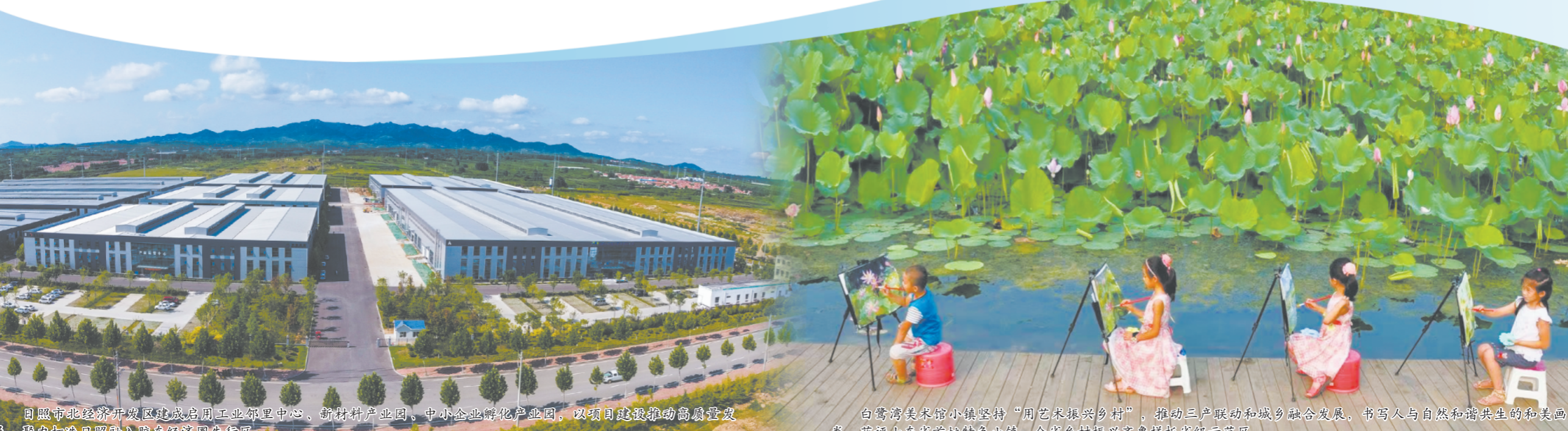
日照市北经济开发区建成启园工业邻里中心、新材料产业园、中小企业孵化产业园，以项目建设推动高质量发展，聚力打造日照融入胶东经济圈先行区。