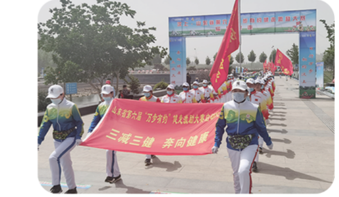
主办山东省第六届“万步有约”健走激励大赛

逐步建立以市为单位的慢病综合防控模式，慢性病监测质量、数量和利用水平进一步提高；深入开展“一评二控三减四健”专项行动；全面启动“三减控三高”项目，开展“三减”超市大赢家活动，积极推广“预包装食品信息查询”微信小程序，助力健康食品选择。推进健康支持性环境建设，精心培植“健康细胞”，开展健康科普知识大答题活动，参与答题近千万人次。