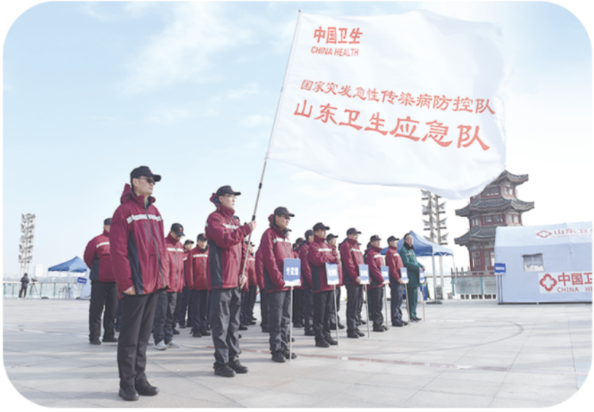
未雨绸缪 以练代战

时间，忠实地记录下奋斗者的足迹。2003年省疾控在原卫生防疫站的基础上重新组建，疾控人发扬“特别能吃苦、特别能战斗、特别能奉献”的精神，依靠老卫生防疫站模式抗击非典疫情，参与黄河抗洪救灾，荣获“全省先进基层党组织”称号，记集体一等功。二十载风雨砥砺，在历届领导班子的努力下，从搭建平台将人才引进来，到新时代创造机会让人走出去历练，再到新发展阶段抢抓机遇强起来，以人民健康为中心的发展理念贯彻始终，志在一流，构筑百姓健康长城的“山东疾控力量”充分彰显，省疾控不断书写与国家和人民呼吸共命运的瑰丽篇章。