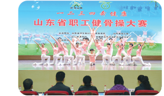
承办“一二三四奔健康”山东省职工健骨操大赛

沙场百战未解，征途万里再启程。锚定建设一流疾控中心的任务目标，山东省疾病预防控制中心将更加坚定地深化改革创新，努力构建“五型疾控”、争创“五个一流”，努力实现“五个全面提升”，全力推动疾病预防控制事业高质量发展！