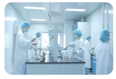
实验室检测“一锤定音”