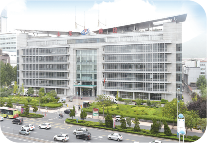
山东省疾病预防控制中心综合业务大楼

这是勇毅笃行的坚实步履—— 二十年来，特别是党的十八大以来，省疾控坚持人民至上、生命至上，将健康融入所有政策，于重点领域集中发力，通过先行先试，积累经验，树立样板，为全国疾控中心改革发展提供示范和借鉴，具有山东特色的专业化、现代化一流疾控中心建设成效显著。事非经过不知难，成如容易却艰辛。二十年砥砺前行，省疾控在中心党委领导下，积极贯彻落实以人民健康为中心的发展理念，凝心聚力、锐意进取、攻坚克难，谱写了一曲壮丽的山东疾控之歌。