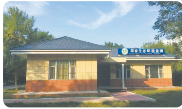
临沂北大桥水质自动监测站