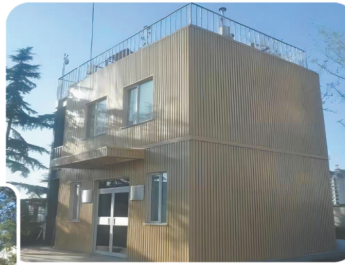
山东省生态环境厅大气超级监测站