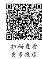
扫码查看更多报道