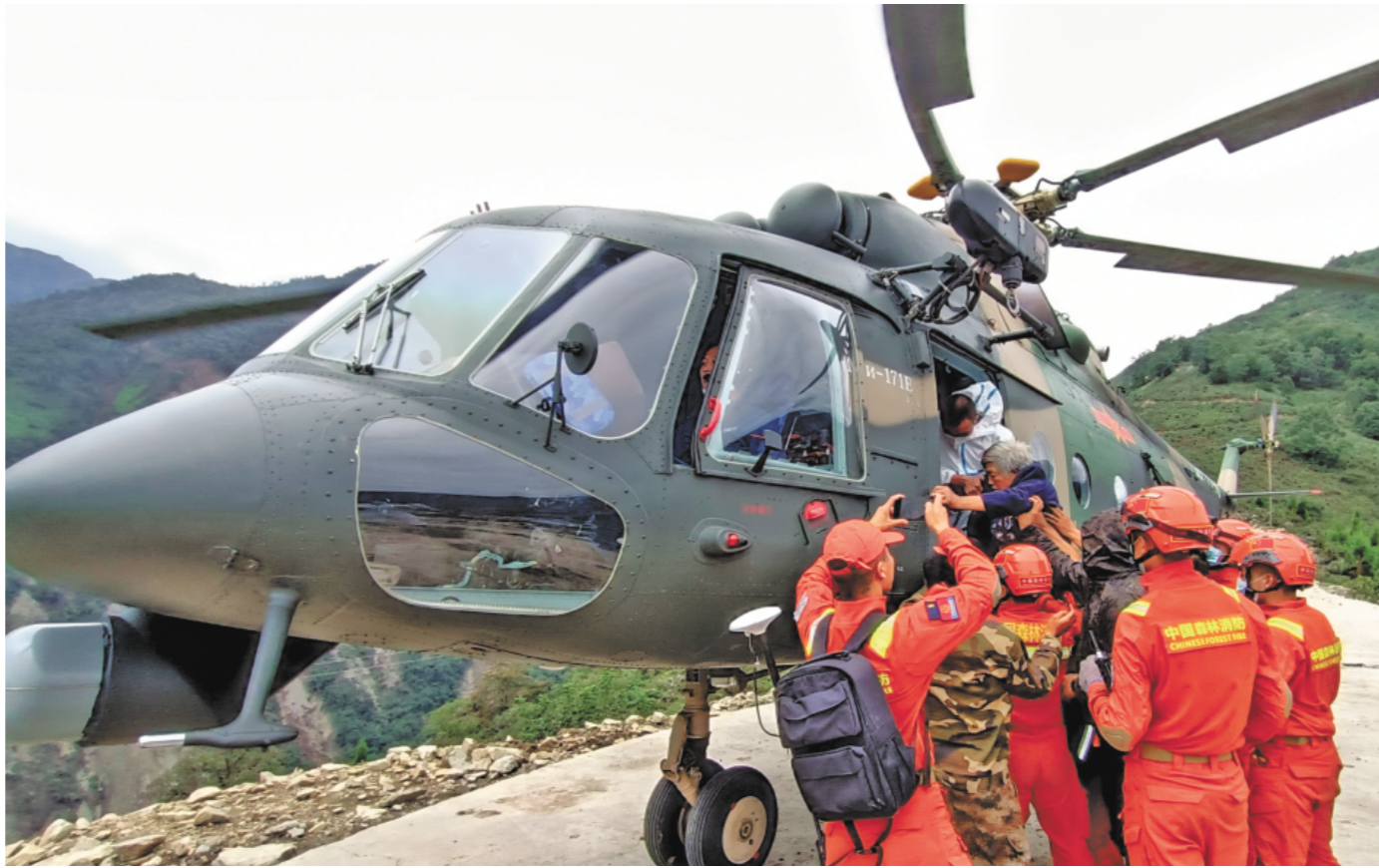
9月6日，陆军第77集团军某陆航旅出动直升机在泸定县转移受伤人员。