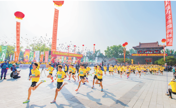
□记者 曹儒峰 报道 9月6日上午，第三十六届泰山国际登山节举行。泰山国际登山节始创于1987年，已成为宣传泰山、展示泰安和繁荣体育事业、发展全民健身的重要窗口和节日。

据了解，卫生管理研究职称评价范围为我省卫生健康、医疗保障企事业单位中，从事卫生管理研究工作的在岗专业技术人员。关于层级设置及评价方式，《通知》明确，在哲学社会科学系列研究专业，增设初级、中级、副高级、正高级四个层级，名称分别为研究实习员、助理研究员、副研究员、研究员。研究实习员、助理研究员实行全省统一考试方式，考试合格即取得相应职称；副研究员采取考试与评审相结合方式，考试合格并符合申报条件的，可在有效期内申报副研究员，评审通过后取得副研究员职称；研究员采取评审方式，评审通过后取得研究员职称。