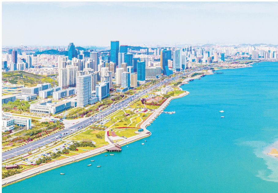
唐岛湾国家湿地公园鸟瞰图。