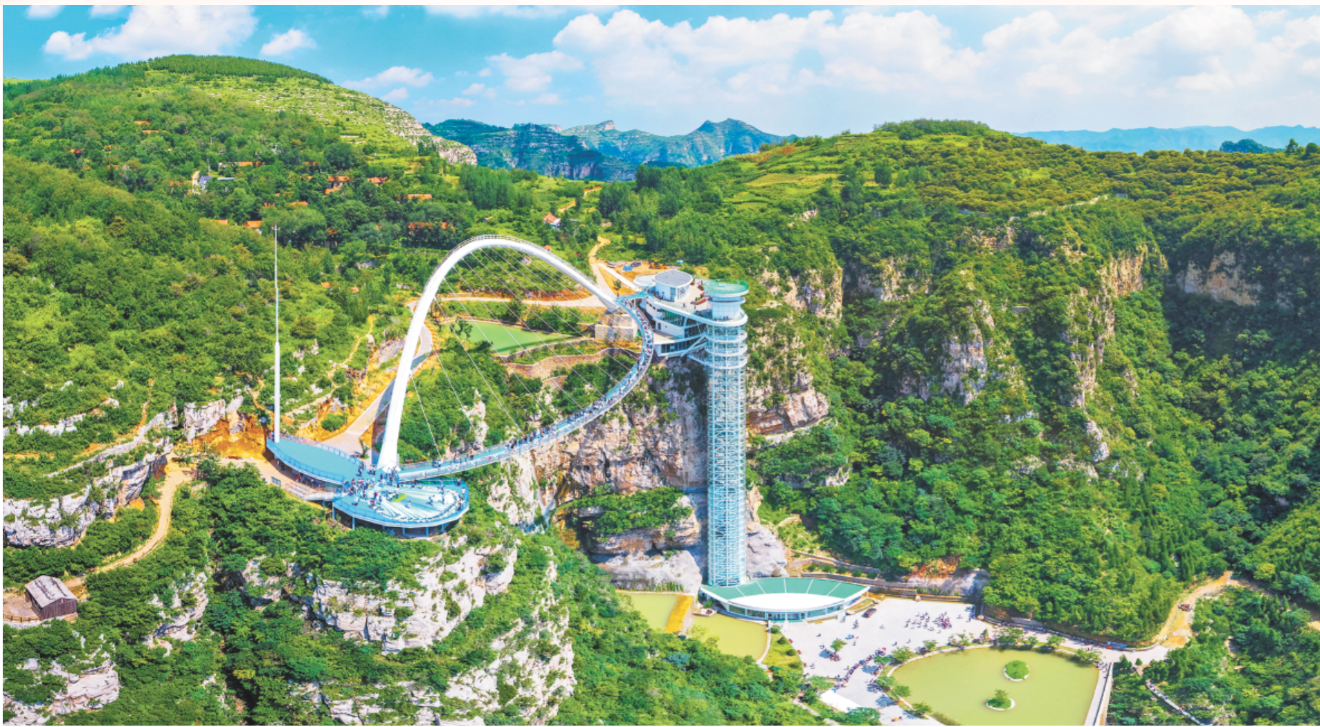
淄博发挥自然生态资源优势，融合地方特色文化，打造一系列重点文旅项目，着力推进全域旅游城市建设。图为潭溪山旅游度假区。