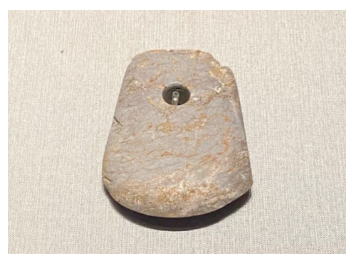
石钺 大汶口文化中后期