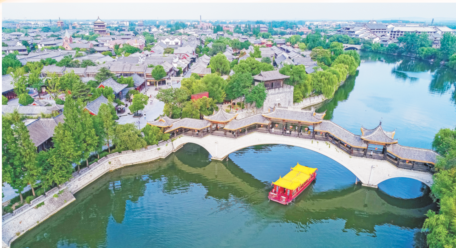
枣庄市推动构建全域旅游新格局，持续释放消费潜力。在台儿庄古城内运河上，画舫载着游客驶过步云桥。