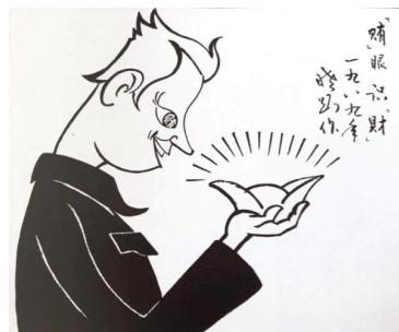
漫画“贿”眼识“财” 刘晓刚

刘晓刚 1931年生于山东省沂南县,1945年1月参加八路军。先后在鲁中大众报社、鲁中南报社、农村大众报社、大众日报社工作。大众日报社高级编辑、山东省新闻美术家协会名誉主席、山东省美术家协会顾问、山东画院高级画师、山东老年书画研究会副会长,系中国美术家协会会员、中国书法家协会会员、中国版画家协会会员。从事美术工作半个世纪,在山东及全国报刊上发表各类美术作品4000余件,百余幅佳作入选省级及全国展览,多次获奖。1996年获中国版画最高奖“鲁迅版画奖”,作品被孟良崮战役纪念馆收藏。出版有《刘晓刚山水画集》《刘晓刚版画选集》《刘晓刚写生选集》《刘晓刚花鸟画集》《刘晓刚书法集》《刘晓刚漫画集》等。2009年,刘晓刚艺术馆在临沂落成。