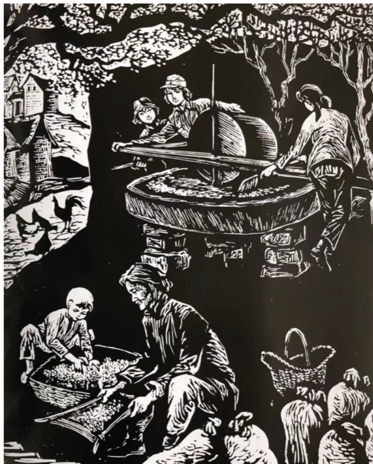
版画 同心协力 刘晓刚