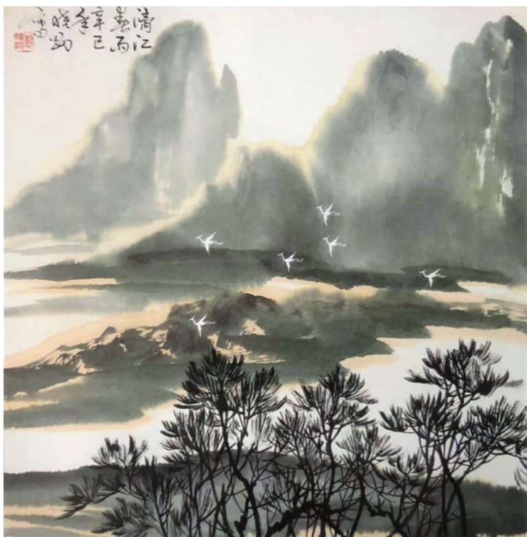
中国画 漓江春雨 刘晓刚