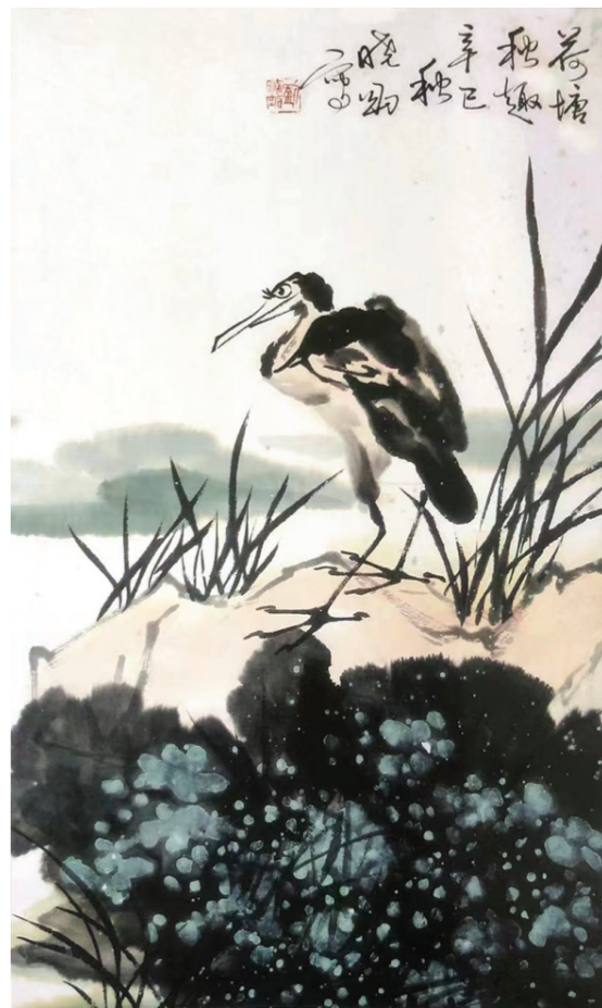
中国画 荷塘秋趣 刘晓刚