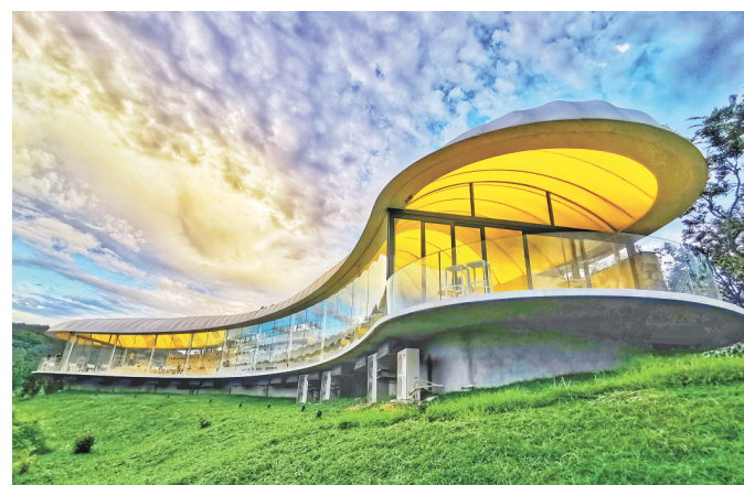
□ 记者 刘涛 通讯员 万莉 报道

去年，省供销社在率先启动沂水、新泰、莱芜等15个县（市、区）县乡村三级商贸流通服务网络建设的基础上，今年将全省系统商贸流通服务网络示范县扩展到30个。截至目前，已新建和改造县域供销集配中心28个、乡镇供销综合服务站224个、村级综合服务站1529个。目前，沂水、新泰、枣庄、滕州等县（市、区）供销社已联合当地快递企业，开展统一配送到村服务。30个示范县供销社商超企业均在直营网点设立农产品收购区，打通了农产品上行“最先一公里”。