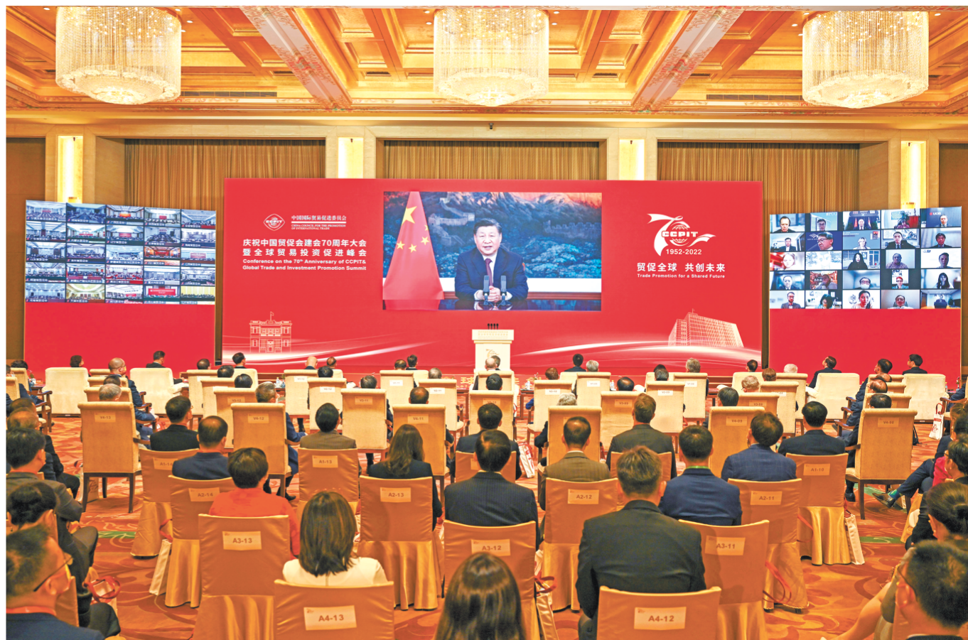
5月18日，国家主席习近平在庆祝中国国际贸易促进委员会建会70周年大会暨全球贸易投资促进峰会上发表视频致辞。