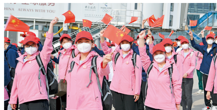
山东省援沪核酸检测队返鲁

省政协副主席赵家军、于国安、唐洲雁、王修林、程林、刘均刚、段青英、省政协党组成员孙述涛、省政协秘书长边祥慧出席会议。各市政协主席列席会议。会议在济南设主会场，在香港、澳门设分会场。