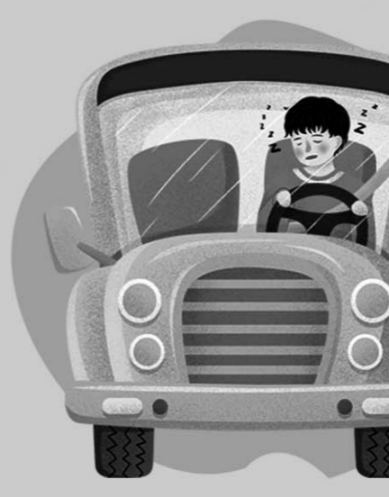
停车时不在车内开空调睡觉