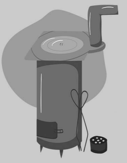
燃烧煤炭取暖要注意