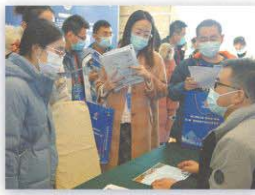
博士们在活动现场与用人单位对接洽谈

素来尊重知识、尊重人才的青岛愿携手“全球合伙人”，加快建设创新型城市，持续优化营商环境，不断提升城市品质，全力增进民生福祉，让城市更加充满活力、富有实力、独具魅力。