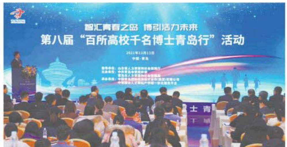
第八届“百所高校千名博士青岛行”活动在青举行

“第一张名片，青岛是一座‘青春之岛’，每名博士人才都可以在这里施展才华、逐梦未来；第二张名片，青岛是一座‘创业之城’，每名博士人才都可以在这里创新创造、收获成功；第三张名片，青岛是一座‘幸福之都’，每名博士人才都可以在这里安居乐业、享受幸福。”青岛市委组织部有关负责同志在致辞中用三张“名片”介绍青岛，并向在场的博士们发出了诚挚的邀请。