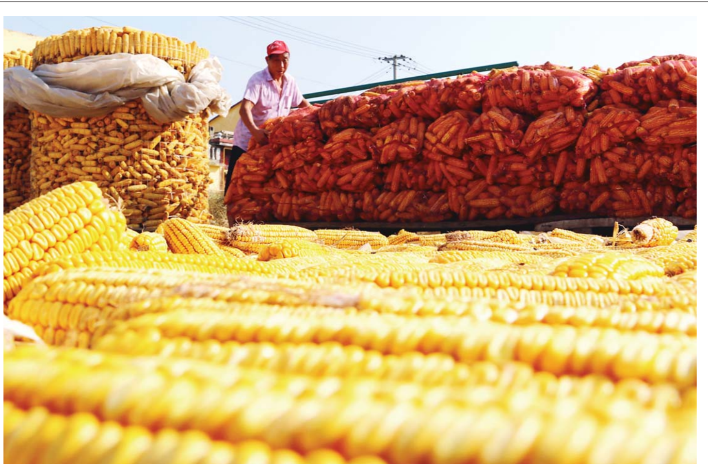
10月23日，菏泽市牡丹区王浩屯镇观音王村村民在堆放晒干的玉米。牡丹区农民抢抓晴好天气对玉米进行收获、晾晒、储藏，乡村处处呈现丰收景象。针对今年雨水较多的特殊天气，牡丹区采取多种形式指导群众做好秋收备播工作，为农业生产顺利开展提供保障。

“法治+乡贤”乡村治理模式，成为基层社会治理的“稳定器”，田桥镇呈现出社会稳定、经济高质量发展的良好局面，先后获得全省安全生产先进单位、市重点镇、全国文明城市等荣誉称号。