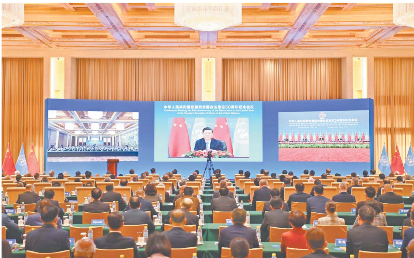
□新华社记者 李响 报道

10月25日，国家主席习近平在北京出席中华人民共和国恢复联合国合法席位50周年纪念会议并发表重要讲话。