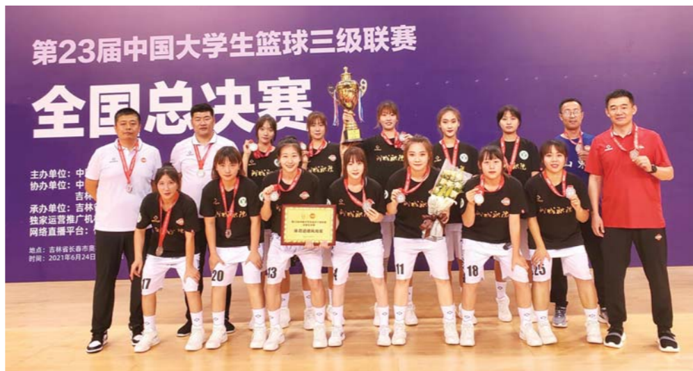
□ 通讯员 孔祥云 夏鲲鹏 报道 聊城职业技术学院女子篮球队获第23届中国大学生篮球三级联赛亚军。

尼采说，每一个不曾起舞的日子，都是对生命的辜负。在奋起争先中，聊职女篮每天都在拼搏，每天都在进步。赛场上每个瞬间似乎都可以定格成美好的记忆。今年全国总决赛赛场上，赛程跌宕起伏。小组赛第三场对阵全国前三的实力球队，最后一节对方