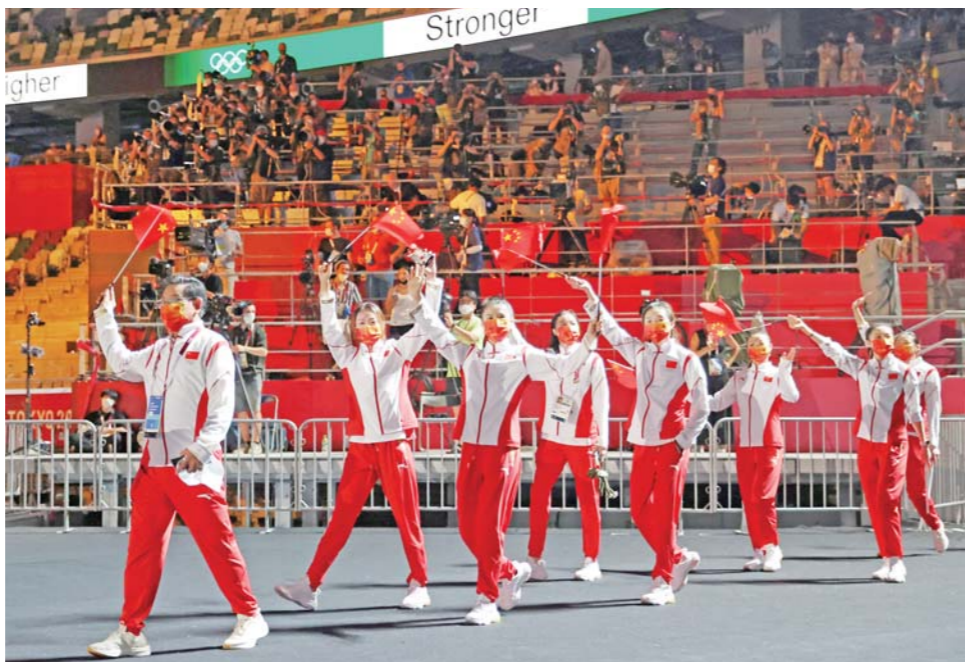
8月8日，第32届夏季奥林匹克运动会闭幕式在日本东京举行。这是中国体育代表团成员进入体育场。

挂青年身心健康，习近平总书记提醒“年轻人不要老熬夜”；为当代青年减压，总书记提出“在青年成长的关键处、要紧时拉一把、帮一下”；体察到青年成长路上面临的不易，总书记要求解决好青年在毕业求职、创新创业、社会融入、婚恋交友、老人赡养、子女教育等方面的操心事、烦心事…… 从新中国历史上第一个青年发展规划制定出台，到教育、就业、创业等领域一系列惠及青年的政策不断推出，再到培育青年人才、培养青年干部的扎实举措……党的十八大以来，在以习近平总书记为核心的党中央亲切关怀下，各地各部门为青年追梦圆梦搭建起越来越广阔的舞台，给奋斗者以越来越有力的支撑和托举。