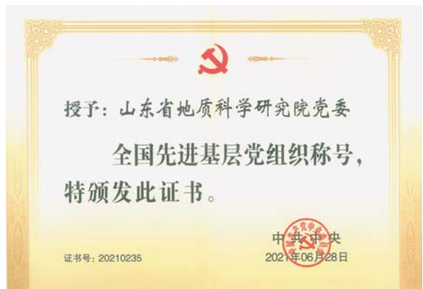
2021年6月,省地科院党委被党中央表彰为“全国先进基层党组织”