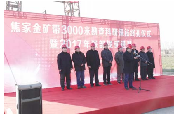
省地科院在胶东焦家金矿带深部成功实施3266.06米勘查科研深钻

“双带头人”制,助推党建与业务双促进双提升,全院技术支持能力、科技创新能力、科技竞争能力、科学发展能力显著增强。在2020年度全省66家自然科学工程技术研究事业单位绩效考核中位列第一。一方面大力实施“科技立院”“创新兴院”战略,科技创新能力显著增强,地质找矿与地学科取得重大进展。近3年,全院提交煤炭资源量24亿吨、铁矿3亿多吨,岩盐矿300余亿吨。在胶东焦家金矿带深部成功实施3266.06米勘查科研深钻,在近3000米处发现厚度25.20米、最高品位达13.65×10 -6 的金矿体,被誉为“中国岩金第一见矿深钻”。近两年获得省部级科技成果奖励10余项,发表学术论文140余篇,专利10项、专著3部,研制国家一级标准物质10个。另一方面,大力实施“人才强院”“平台稳院”战略,强化科技竞争能力和科学发展能力,人才队伍和平台建设取得新成效,为科技自立自强奠定坚实基础。长期聘任8位院士和多名专家担任技术顾问和学术委员会委员;建设泰山学者科研团队和自然资源部科技平台体系;自筹资金3800万元引进了世界上最先进的二次离子探针质谱仪,打造国际一流的山东离子探针中心。同时,对自然资源管理的技术服务支撑更加有力。在矿产资源规划、绿色矿山建设、国土空间规划、生态修复规划、土地资源研究、地质遗迹调查与保护、地质环境调查与生态修复、矿业权督查、科技成果管理、标准化建设、《山东国土资源》《山东自然资源通讯》编辑发行等方面,为省自然资源厅提供全方位技术服务支撑。