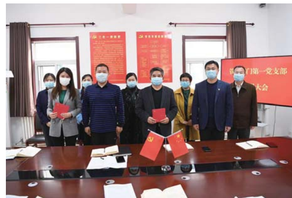
为党员过“政治生日”

准打造院党史教育馆,在展示党的重大历史事件和精神谱系的同时,总结展示“一支部一品牌”创建成果、院红色传承典型人物和“两优一先”光荣榜,得到各观摩单位的普遍认可,“一支部一品牌”被省自然资源厅在全系统推广。2020年11月,院党委“党建引领、金石为开”党建文化品牌被省机关党建研究专委会评为“全省机关党建优秀创新案例一等奖”。