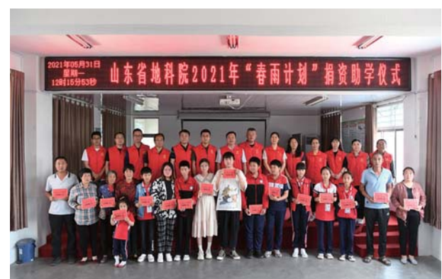
每年职工捐款开展“春雨计划”资助沂南县16名学生