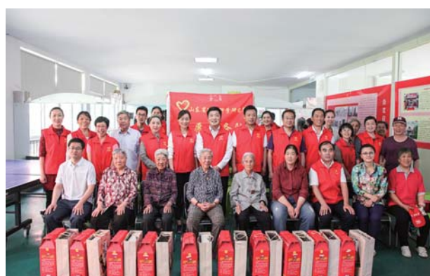
到金色阳光社区看望老人并开展公益活动