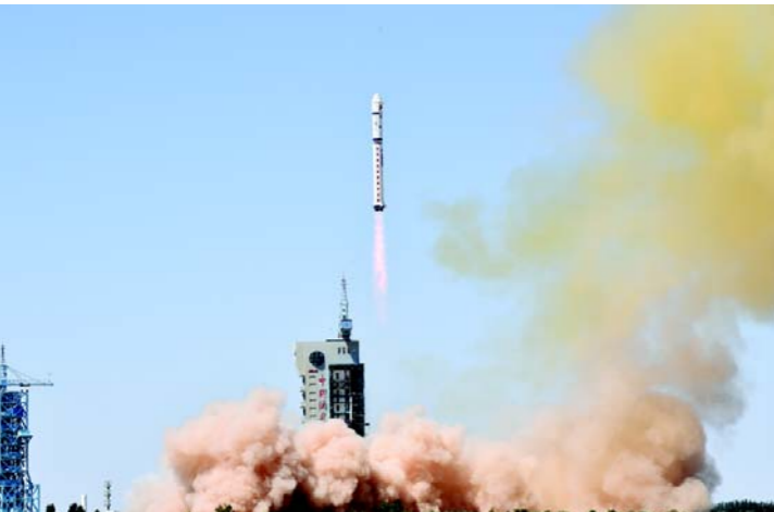
新华社发 (江江波 报道) 7月29日12时01分，我国在酒泉卫星发射中心用长征二号丁运载火箭，成功将天绘一号04星发射升空，卫星顺利进入预定轨道，发射任务获得圆满成功。

据新华社石家庄7月29日电 (记者 李继伟) 29日，《河北雄安新区条例》经河北省第十三届人大常委会第二十四次会议审议通过，将于今年9月1日正式实施。“制定《河北雄安新区条例》十分必要且紧迫。”河北省人大常委会法工委主任周英介绍，随着雄安新区规划建设持续推进，中央和河北省关于支持雄安新区的各项决策部署，需要通过立法予以保障实施；雄安新区行政管理体制、高质量发展、改革开放等关键性、综合性事项，需要通过立法予以引导和规范。《河北雄安新区条例》聚焦将雄安新区建设成为北京非首都功能疏解集中承载地、高质量高水平社会主义现代化城市的功能定位，重点从管理体制、规划与建设、高质量发展、改革与开放、生态环境保护、公共服务、协同发展、法治保障等8个方面进行了系统规定。