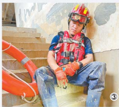
□ 记者 赵丰 王红军 报道 图①:7月26日,聊城支队消防指战员身着装备,到地下车库调整浮艇泵。图②:山东救援力量奋战排涝救灾一线。图③:7月26日,滨州支队的一名消防队员在满是泥水的台阶上,靠着墙进行短暂休息。