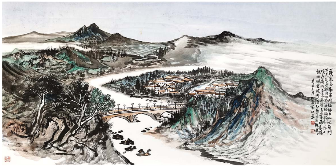
—溪流水数家村 刘仲原 136cm×68cm