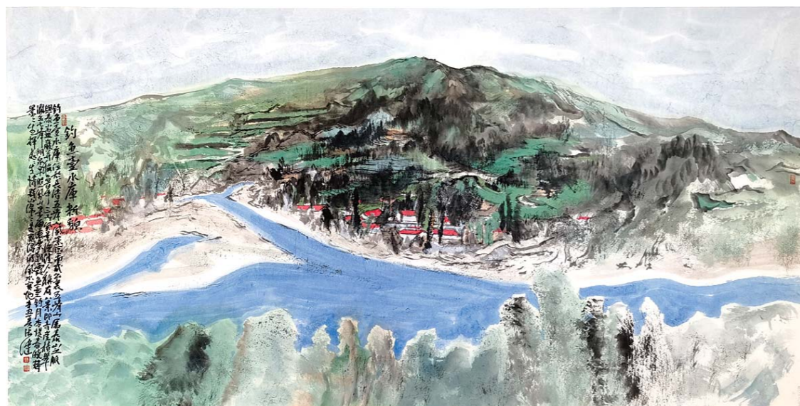
钓鱼台水库新貌 张健 136cm×68cm

1983年生。中国美术家协会会员，山东省美术家协会驻会副秘书长、展览培训部副主任、山水画艺委会常务副秘书长，山东省青年美术家协会副主席，《中国书画》杂志社书画院特聘画家，山东艺术家书画学术委员会会委，岱云社成员。