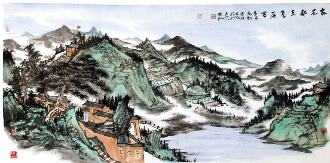
家家都在翠屏间 陈凯 136cm×68cm

1977年生，九三学社社员。山东工艺美术学院造型艺术学院国画教师，文化部文化人才中心培训导师，中国国家工艺美术协会会员，山东省美术家协会会员，山东鲁艺书画研究中心研究员。