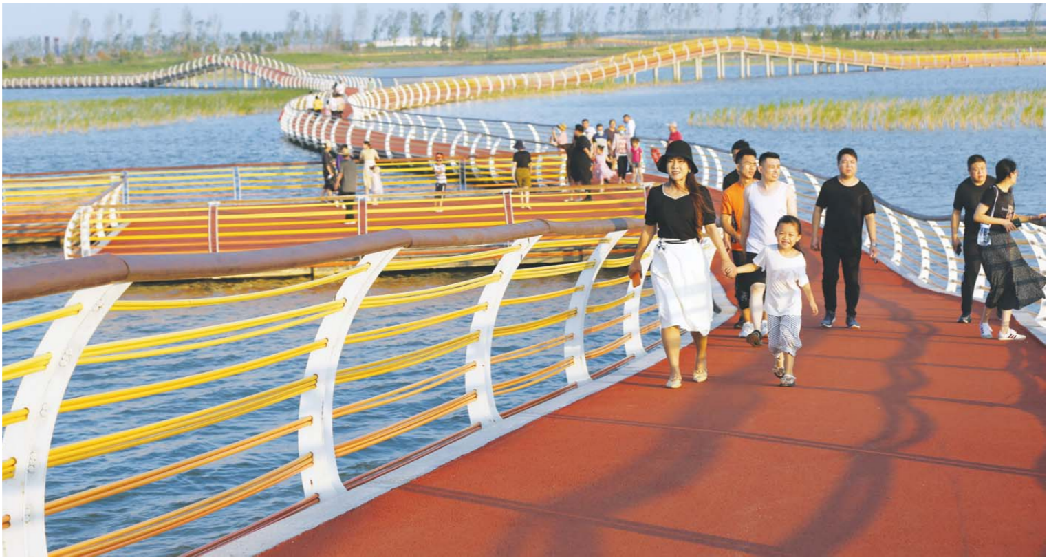
7月18日,东营市民悠闲地漫步在天鹅湖蓄滞洪湿地的“网红”栈道上。近日,这条造型别致的长彩虹栈道成为当地众多市民抖音和朋友圈的展示主角。天鹅湖蓄滞洪工程是东营市着眼城市防汛安全、生态安全、水源安全和城市未来发展实施的重大战略工程。

生态“大文章”越做越好,也为东营文旅产业发展提供了基础支撑。近年来,东营以实施“旅游富民”三年行动计划为抓手,集中推进一批生态教育、自然体验、文化旅游精品项目,努力把东营打造成亲近母亲河、回归大自然的生态家园、文化家园、精神家园,打造东营一线休闲度假城市。“黄河入海、我们回家”文化旅游品牌已经打响,一个个美丽景点和文旅风光,赢得东营市民和外地游客纷纷点赞。