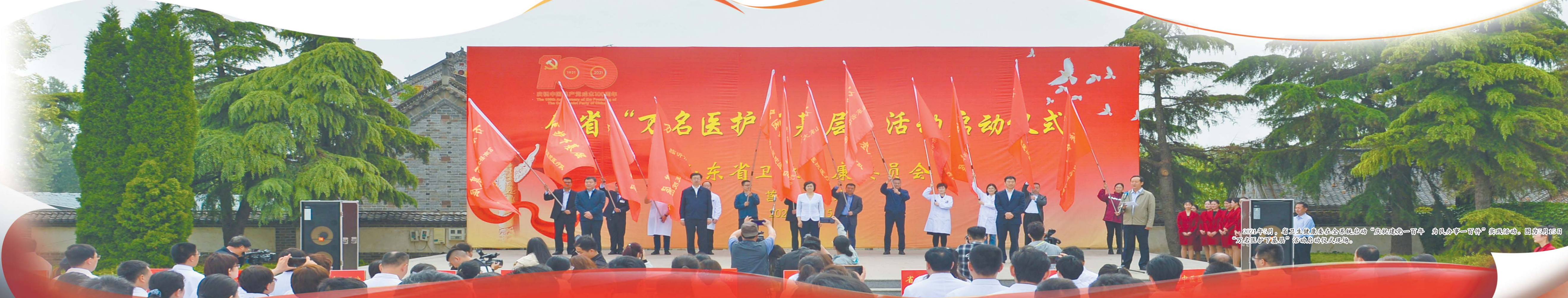
2021年6月，省卫生健康委在全省启动“庆祝建党一百周年 万名医护下基层”公益活动启动仪式。图为15日“万名医护下基层”启动仪式现场。