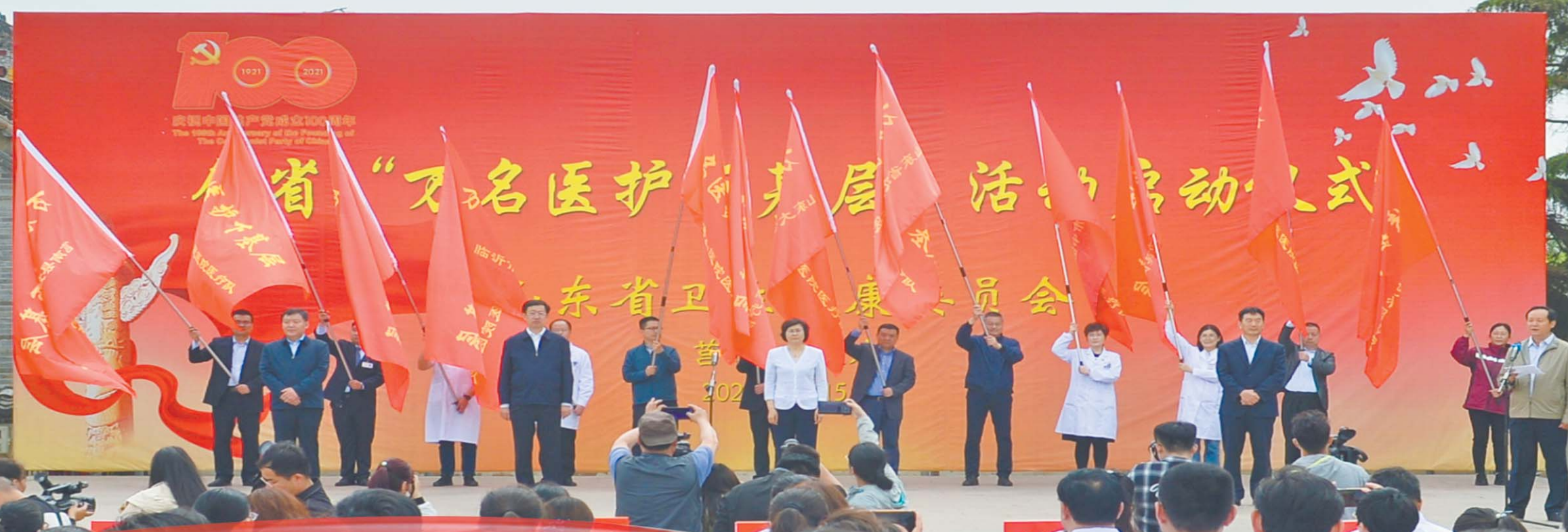
2021年6月，省卫生健康委在全省启动“庆祝建党一百周年 为民办实事”系列活动，图为5月15日“万名医护下基层”活动的启动仪式。