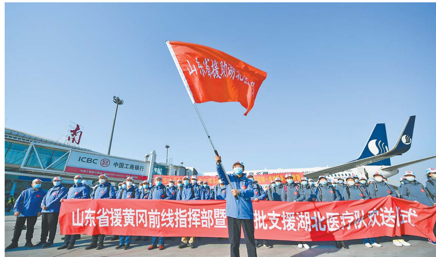
2020年2月13日，山东省援黄冈前线指挥部暨第十批支援湖北医疗队出征。

四、全面落实改革创新，医药卫生体制改革不断深化。省委、省政府高度重视医改工作，印发《关于进一步深化医药卫生体制改革的实施意见》，明确省长任组长的省医改领导小组，深化医改推进机制全面加强。分级诊疗制度建设成效初显。落实“县域医共体全覆盖”要求，全