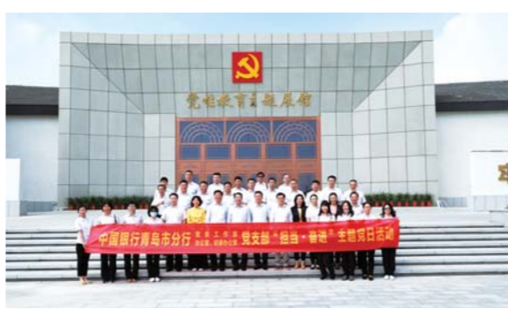
中国银行青岛市分行开展主题党日

着力强化创新理论武装，加强党员教育管理。举办学习贯彻党的十九届五中全会精神轮训班、党的理论及党性修养网上专题系列学习班，引导广大党员把智慧和力量凝聚到落实全会确定的重大任务上来。科学编制年度党组织工作经费和党费预算，积极支持各级党组织开展形式多样的主题党日、党建共建等活动，丰富党