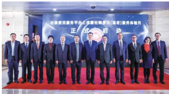
“社银便民服务平台线上暨社银便民(送老)服务体验月”启动

党建工作做实了就是生产力，做细了就是凝聚力，做强了就是战斗力。分行党委充分发挥把方向、管大局、保落实的作用，着力加强顶层设计，加快推进业务发展。全面启动品牌建设工程、产品带动战略及EVA提升攻坚战，制定实施一系列政策措施，引导全行牢固树立“服务于地方经济，依托于地方经济，在支持地方经济发展过程中实现自身健康发展”的工作思路，以实际行动体现国有大行的责任担当。