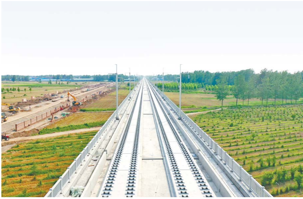
图为鲁南高铁荷兰段(山东段)铺轨线路。

鲁南高铁正线全长477公里，设计时速350公里，采取分段建设模式，荷兰段线路全长84.9公里，其中山东段长度为43.7公里。荷兰段(山东段)预计2021年底具备通车条件。